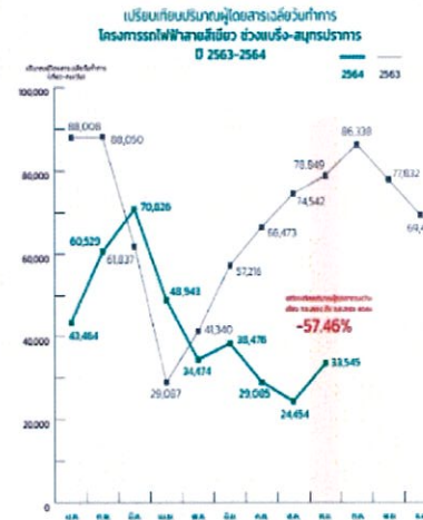
ช่วงแบริง-สมุทรปราการ