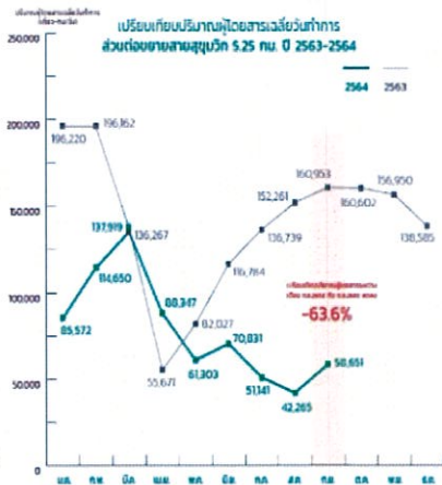
ส่วนต่อขยายสายสุขุมวิท